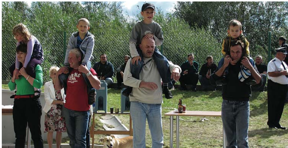
Konkurencja dla rodziców i ich pociech, kto szybciej biegnie z dzieckiem „na baranach“?

przez młodzież. Chętni mogli też unieść się na podnośniku strażackim. Imprezę zakończyła wieczorna dyskoteka. ag