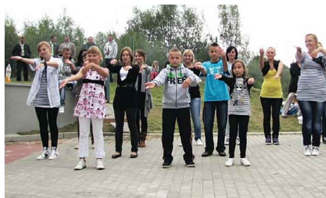
Młodzież zaprezentowała nie tylko skecze kabaretowe, ale też pokaz „macareny“