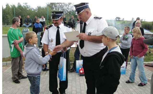
Na zwycięzców konkursów czekały dyplomy i nagrody rzeczowe