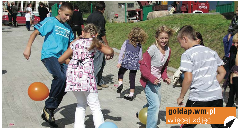
Rywalizacja między młodszymi uczestnikami festynu była zacięta