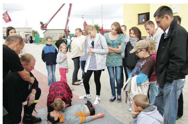
Każda okazja jest dobra, aby zaserwować mieszkańcom pokaz udzielania pierwszej pomocy